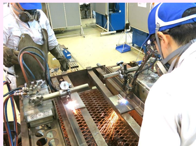
自動ガス切断実習