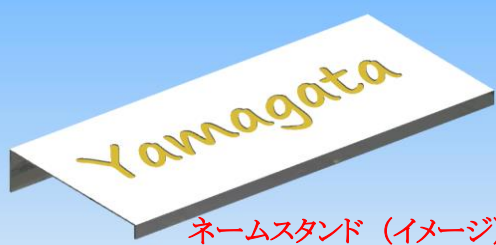
ネームスタンド(イメージ)